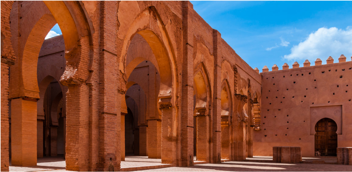
majonit. Pfeilerhalle der Moschee von Tinmal; Marokko