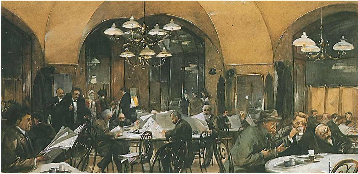
Völkel, R. Café Grienstadt 1896.