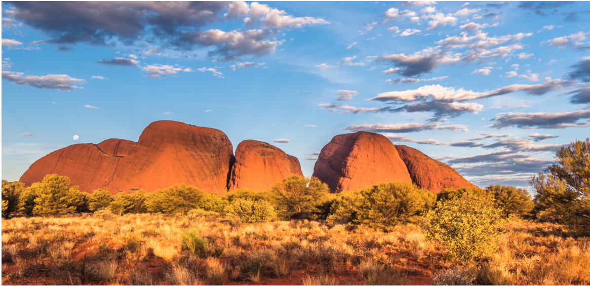
vaclav: Australia landscape.