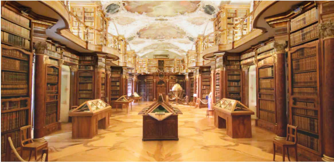
Bobo11. Barocksaal der Stiftsbibliothek St. Gallen