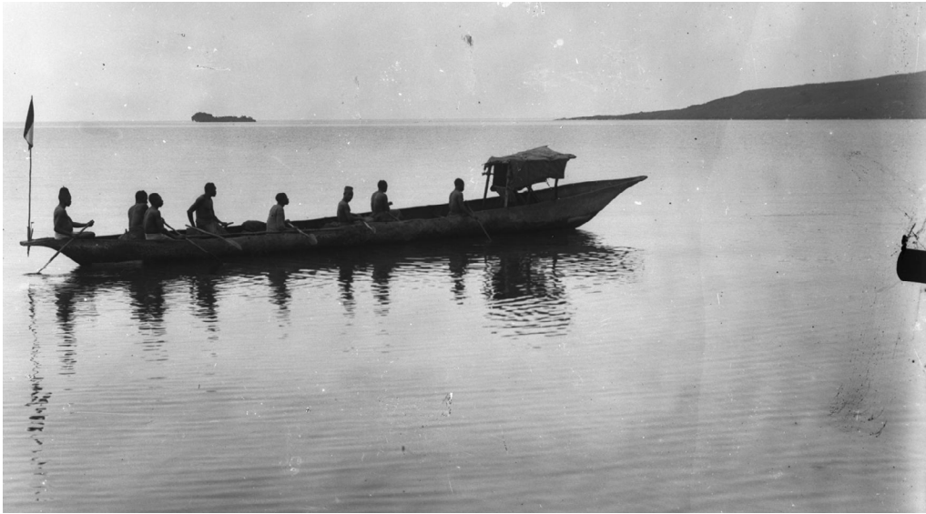
Aufgenommen in Ruanda 1913 (Deutsch-Ostafrika)