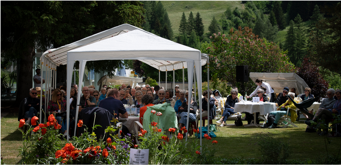
Felsdorfplatz. Lesung mit Robert Menasse am 27. Internationalen Literaturfestival Leukerbad 2023