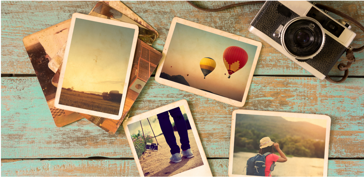
jakkapan. Photo album remembrance and nostalgia in summer journey trip on wood table. instant photo of vintage camera - vintage and retro style