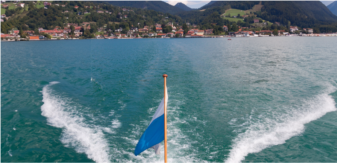
Stafan Schwehofer: Blick auf den Starnberger See