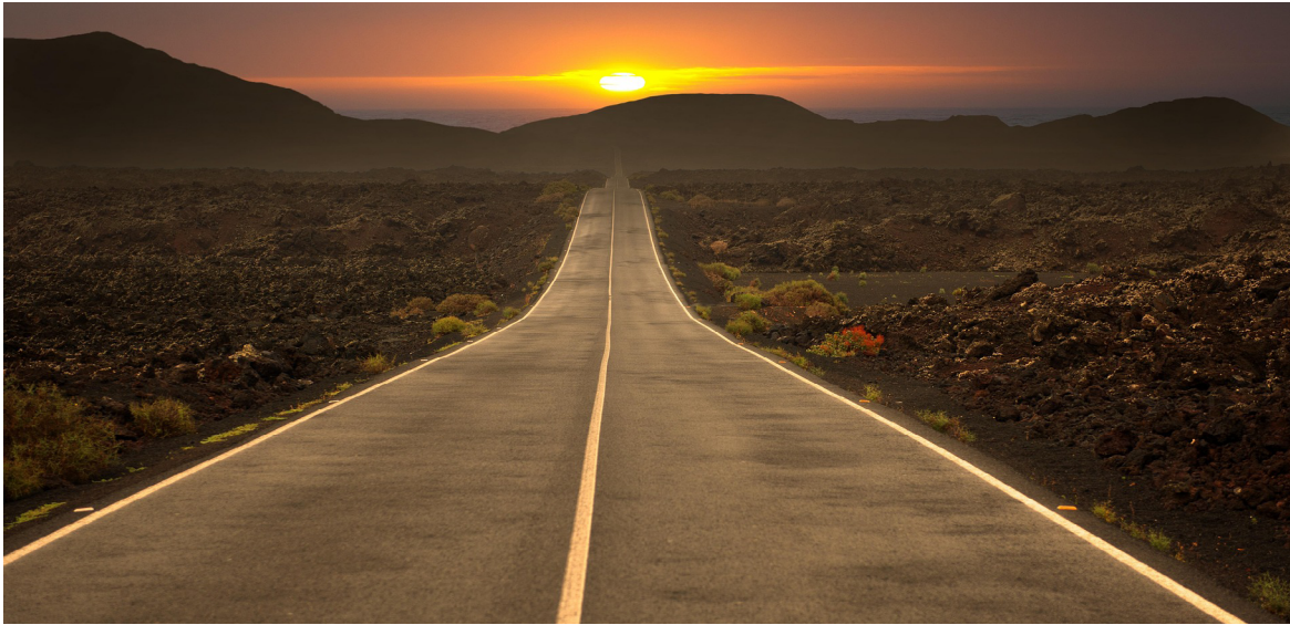
jodeng. Straße, Wüste, Sonnenuntergang